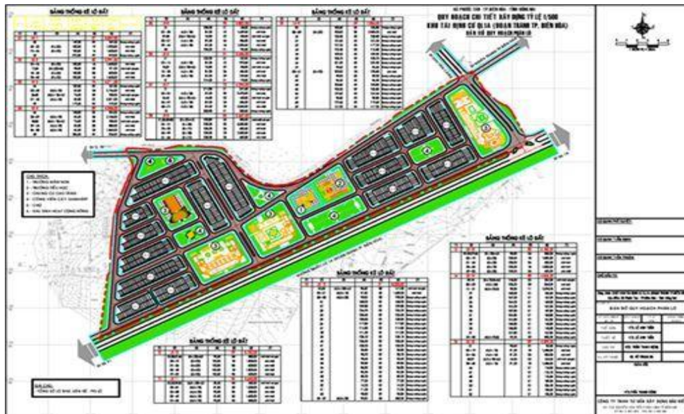
Hình 2: Bản đồ quy hoạch chi tiết xây dựng tỷ lệ 1/500, khu tái định cư Phước Tân