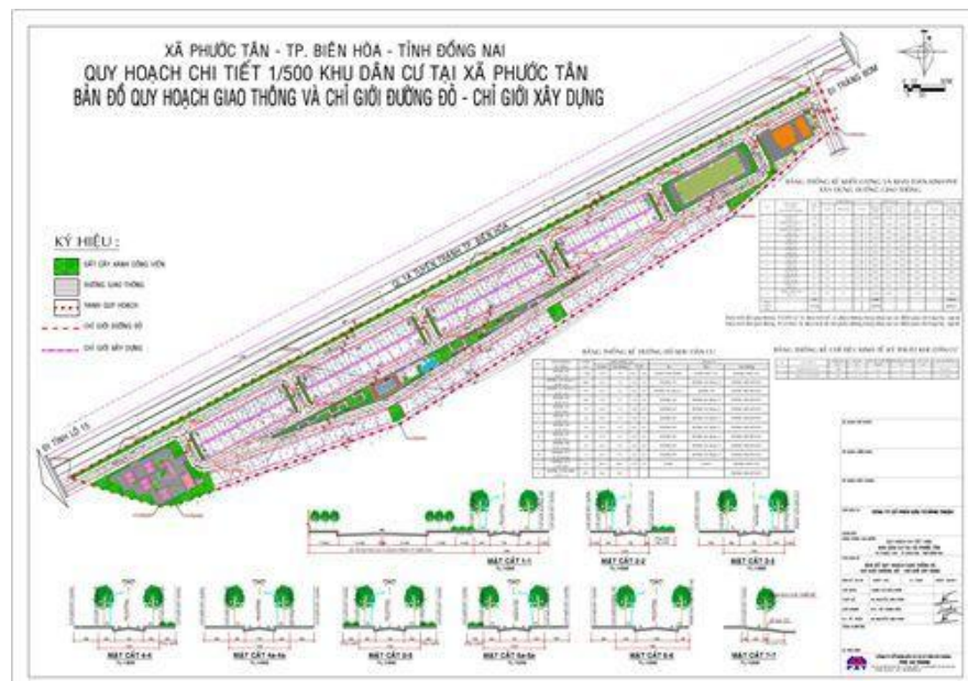
Hình 3: Khu dân cư Phước Tân, 10,42 ha