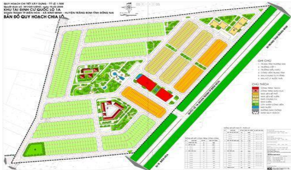
Hình 1: Bản đồ quy hoạch chi tiết xây dựng tỷ lệ 1/500, khu tái định cư Bình Minh

còn 17 hộ chưa bàn giao mặt bằng trong khu vực tái định cư chiếm khoảng 17.238 m 2 (chiếm 6,62%).